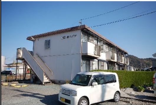
ベランダ側から見て